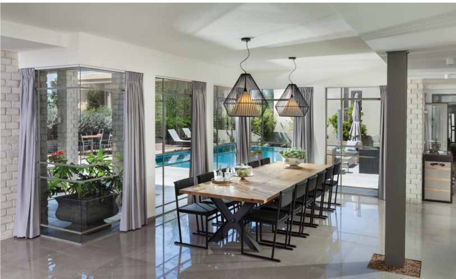
שקיפות ופתיחות מחליפות את מופעה האטום של החזית. משמל נראה הסלון הממוקם בגוש הקטן, ומימין פינת האוכל ומעבר לשאר אזורי הקומה הממוקמים בגוש הגדול. ריצוף באריחי שיש אפורים ופרופיל בלני בוויטריות. פרופיל בלני: "ווינקס".