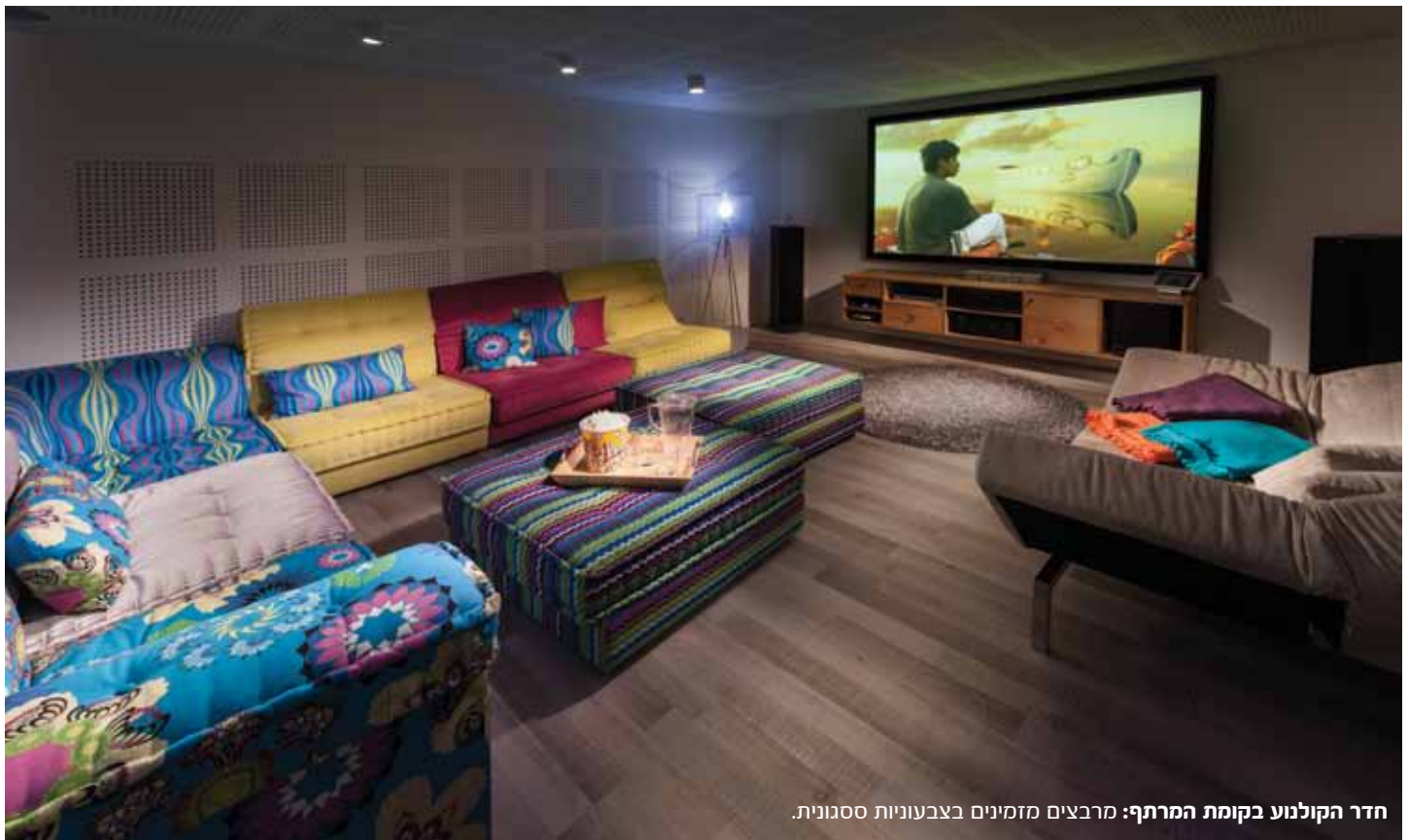
חדר הקולנוע בקומת המרתף: מרביצים מזמינים בצבעוניות ססגונית.