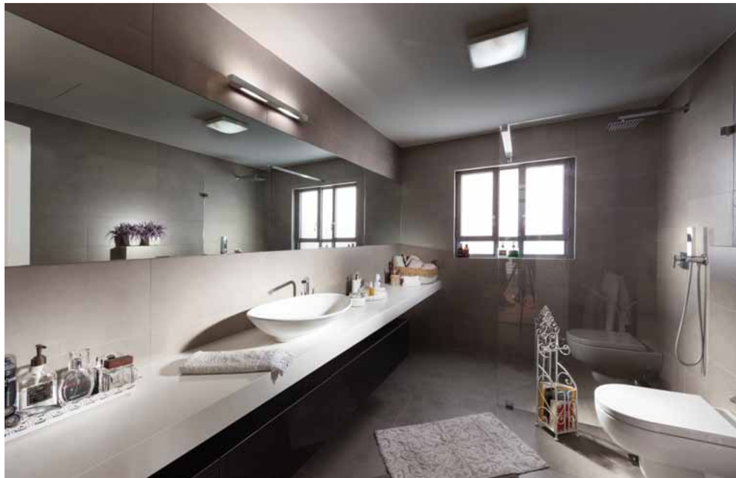
אזור הרחצה שביחידת ההורים: מרווח ומעוצב בקפידה: ריצוף בגרניט פורצלן רקוע, משטח כיור עשוי אבן קיסר לבנה. ריצוף ואביזרים סניטאריים: "מודי".