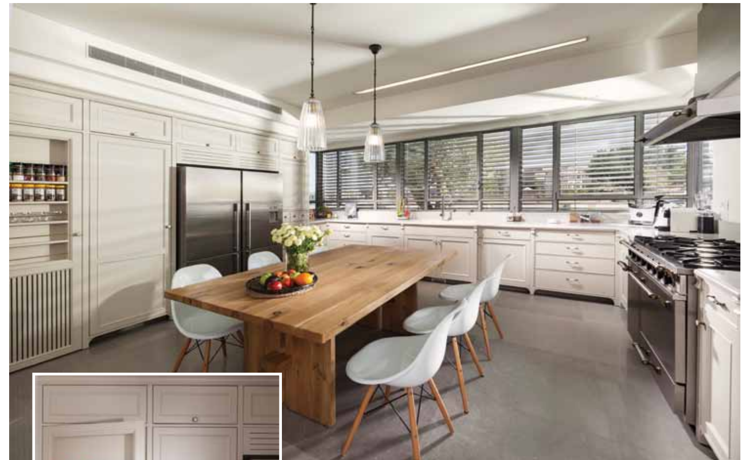
חמימות כפרית במטבח: חזיתות עץ בצביעה ידנית בגון שמנת עם פיגמנט אפרפר, ובמרכז החלל שולחן עץ גדול ומזמין. ביחידת הקיר: חזית "תמימה" שעל פני שטחה משתלבים מדפי תבלינים מתבררת כדלת לכל דבר המובילה למזווה גדול. נגרות מובח: עדי וארז נגרים.