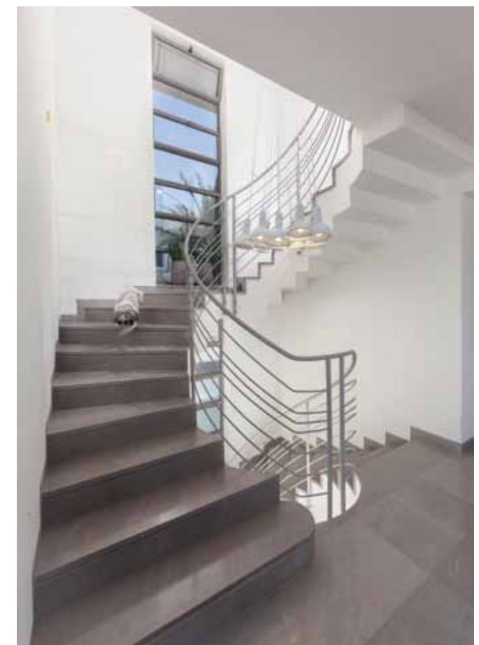
גרם המדרגות הספירלי שמוביל אל קומת המרתף והקומה העליונה.