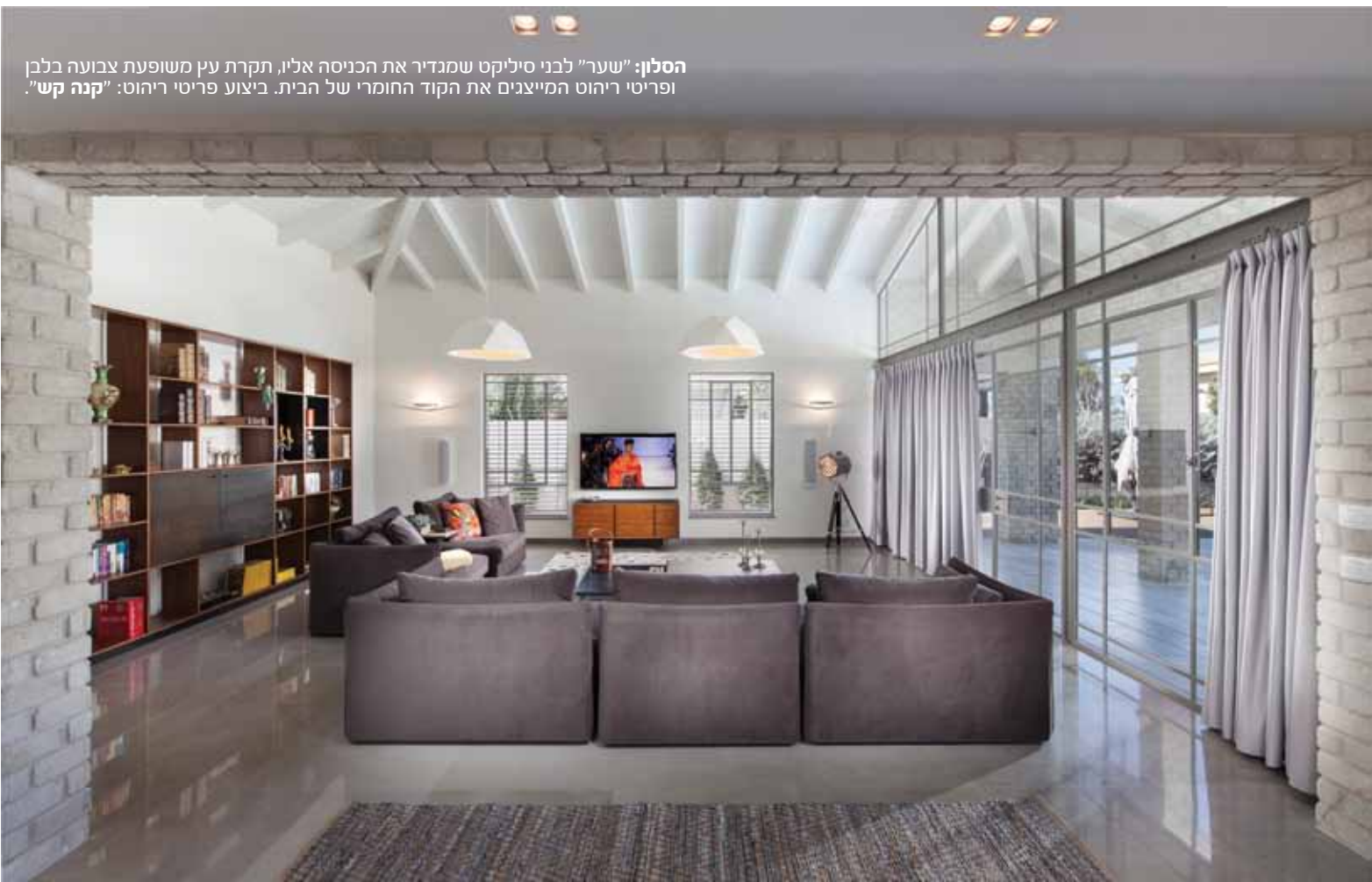
הסלון: "שער" לבני סיליקט שמגדיר את הכניסה אליו, תקרת עץ משופעת צבועה בלבן ופריטי ריהוט המייצגים את הקוד החומרי של הבית. ביצוע פריטי ריהוט: "קנה קש".

מרחב הפנים מאופיין בחזות נינוחה, בתחושת רווחה גדולה וב"הרבה אוויר" – מעברים רחבים ונוחים מאזור לאזור, וזרימת חלל פתוחה אשר בה בעת משמרת היררכיה של פונקציות מוגדרות. מיקומה של דלת הכניסה מסמן את חלוקת החלל, כאשר הגוש הקטן בין השניים ממקם משמאלה ומכיל בשטחו את הסלון, והשני, הממוקם מימינה, מכיל את יתר חללי הקומה והבית, ובכלל זה קומת מרתף וקומה עליונה. עץ, מתכת ולבני סיליקט המופיעים בחזית הקדמית, ממשיכים ומככבים גם בחלל הפנים, כעין קוד חומרי המוביל את עיצוב החמים-מזמין ונוכח באלמנטים מבניים, בשילובים שונים ובנראויות מגוונות: לריצוף משמשים אריחי שיש אפורים, הפתחים הרבים נתונים במסגרות פרופיל בלני, לבני הסיליקט משתלבות באזור הסלון, ואף פריטי הריהוט והנגרות מייצגים את השילוב החומרי. תאורת החלל מנצלת את פרישתו המרווחת ומבוססת בעיקר על גופים דקורטיביים מסוגים שונים – תלויים וצמודי קיר ותקרה, כאשר הריחוק היחסי בין אזור לאזור "מכיל" אותם. אסתטית ומשתלב היטב במארג העיצובי ללא כל תחושת עומס או הכבדה. אזור הסלון מוגדר באמצעות מעין "שער" רחב של לבני סיליקט, וחללו הגבוה מקורה בתקרת עץ משופעת שנגזרה מגג הרעפים ונצבעה בגון הקיר. התקרה ממשיכה וזורמת אל מעבר הויטריות התחמות אותו תוך הגדרת אכסדרה מקורה ביציאה ממנו, כאשר ה"זליגה" החומרית מדגישה ומעצימה את הקשר בין שני המרחבים, והמפתח הגבוה שהותאם לשיפוע התקרה נוסך עניין ייחודי. עיצוב החלל מובחן, משמר מינון מדויק של פריטי ריהוט שנבחרו או עוצבו ייעודית תוך היצמדות לפלטה החומרית, דוגמת ספרייה המשלבת שימוש בבמבוק וברזל, או יחידת אחסון/טלוויזיה שעוצבה מאותם החומרים.