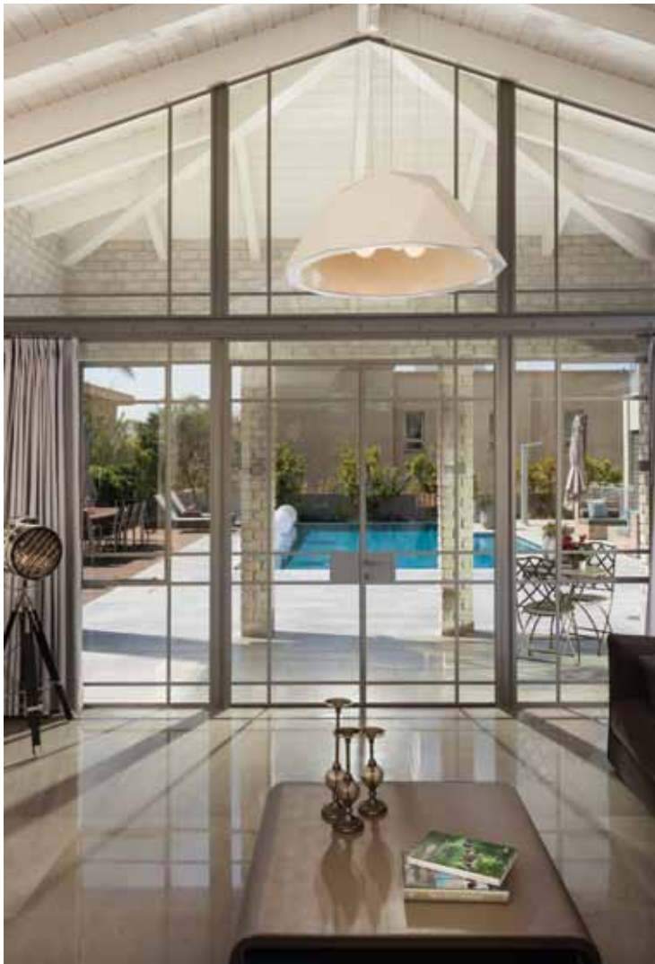
מבט מהסלון אל החוץ: מפתח הוויטרינה מותאם לשיפוע התקרה, ושימושי החומרים הזהים מדגישים המשכיות. לבני סיליקט, ושקיפות המזמנת קשרי עין ישירים בין הפנים והחוץ

מבט מהגינה אל אזור הסלון: התקרה המשופעת "זולגת" החוצה תוך יצירת אקסדרה נעימה ביציאה ממנו.