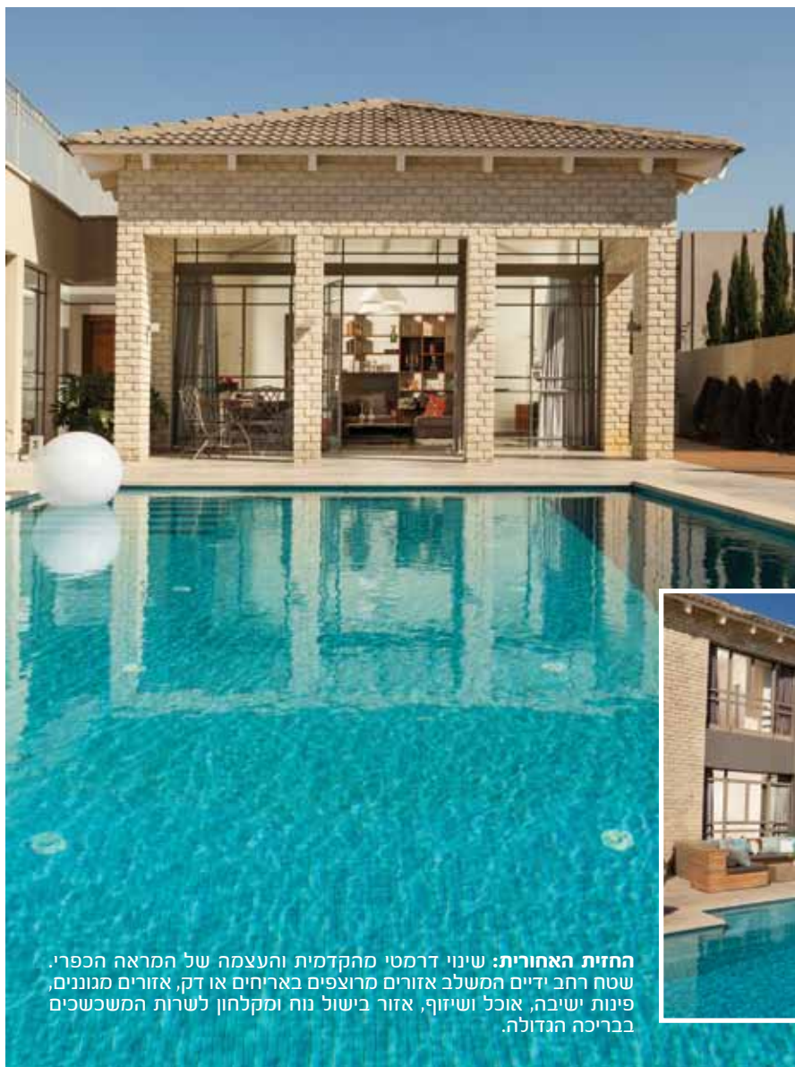
החזית האחורית: שינוי דרמטי מהקדמית והעצמה של המראה הכפרי. שטח רחב ידיים המשלב אזורים מרוצפים באריחים או דק, אזורים מגוננים, פינות ישיבה, אוכל ושיזוף, אזור בישול נוח ומקלחון לשרות המשכשים בבריכה הגדולה.

החצר, שהקשר עמה היה סעיף משמעותי בפרוגרמה, אכן נוכחת היטב בחלל הבית כשהיא נשקפת מבעד הפתחים הגדולים ונופה חודר פנימה דרכם. שטחה עתיר "כל טוב" כיאה למרחב המצוי בשימוש מרובה, וכולל פינות ישיבה ואוכל מרוצפות (הן באריחי חוץ והן בדק עץ), אזורים מגוננים, פינות שיזוף, מטבח חיצוני (??), בריכת שחייה מפנקת שבתוכה משתלבת פונקצית עיסוי ואף מקלחון ייעודי לשירות הטובלים במימיה. וכך, כאשר מצויים בנינה שבחזית האחורית והמבט אל עבר הבית מציג תמונה פתוחה ושונה בתכלית מזו של החזית הקדמית, מתחדד הדיאלוג המתקיים בין הפנים והחוץ: כשם שבכניסה פנימה ניתן להישיר מבט אל שטח החצר, כך גם משטח החצר ניתן להישיר מבט אל חלל הפנים, כאשר שני המרחבים חולקים את אותה תחושת נוחות ונינוחות, ובעיקר, לדברי בלהה "כזו שמתאימה לאורחות חיינו". ■